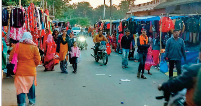
सड़क पर लगी दुकानें, इसकी वजह से जाम की स्थिति बनती है।

साप्ताहिक बाजार बैठकी के लिए नगर पालिका ने डबरीपारा, बाजारपारा के बीच 5 साल में 1 करोड़ रुपए खर्च कर दिए हैं, लेकिन विभागीय अफसरों की अनदेखी व विक्रेताओं की जिद के कारण तीन शोड खाली पड़े हैं। साप्ताहिक बाजार के लिए नगर पालिका ने 2018 में डीएमएफ से 40 लाख रुपए खर्च कर शोड चबूतरा बनवाया। वहीं 2022 में पौनी पसारी योजना के तहत एक बार फिर 60 लाख रुपए से सड़क की दूसरी ओर शोड चबूतरा बनवाया गया, फिर भी सड़की व्यापारी सड़क पर ही दुकानें लगा रहे हैं। दूसरी ओर डबरीपारा में बाजार स्थल पर तालाब किनारे बने 10 दुकानों का आवंटन नहीं होने के कारण दुकानों का बुरा हाल है। शटर बंद होने से जंग लगकर खराब हो चुके हैं। बाजारपारा की मुख्य सड़क पर बाजार न लगे, इसलिए नगर