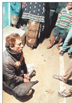
पकड़ा गया आरोपी।

बरबसपुर। एमसीबी जिले के नागपुर पुलिस चौकी अंतर्गत मंगलवार की रात्रि एक ग्रामीण के घर चोरी करने की नीयत से घर घुसने की खबर के वार परिवार के लोगों के द्वारा शोर मचाया गया और इसके बाद तत्काल आस-पड़ोस के लोगों के द्वारा घर में घुसे चोर को पकड़ लिया गया, वहीं दूसरा आरोपी फरार हो गया था, जिसे बाद में पकड़ लिया गया, जिन्हें पुलिस के हवाले कर दिया गया।