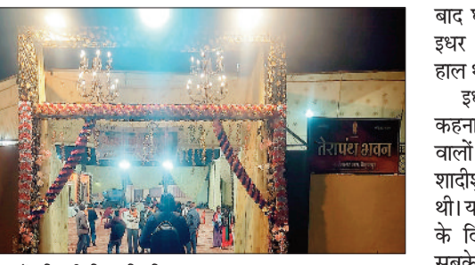
तेरापंथ भवन में की गई थी शादी की व्यवस्था।

जिला मुख्यालय बैकुंठपुर में शादी की खुशियां अचानक गम के माहौल में बदल गईं। दरअसल यहां दुल्हन की जिस लड़के से शादी होने वाली थी, वह पहले से शादीशुदा निकला। दुल्हन को यह बात आने के महज 2 घंटे पहले ही पता चली। दूल्हे की सच्चाई जानने के बाद पीड़ित परिवार ने मामले की शिकायत सिटी कोतवाली में की है। जानकारी के अनुसार बैकुंठपुर निवासी एक युवती की शादी सोनहत थाना क्षेत्र के अंगवारी निवासी से तब